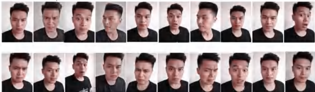
图 4 测试数据图