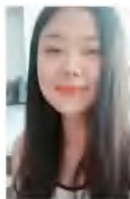
图 3 检测人脸图像

(2) 模拟售票窗口内的摄像头采集回的 20 帧人脸图像信息,作为本系统的测试数据。视像效果如图 4 所示。