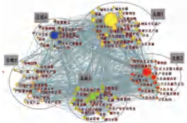
图 3 长三角文化产业研究热点聚类图

高频词最低出现次数为 16 次, 共 84 个高频关键词。选择 Vosviewer 软件对 84 个高频关键词进行聚类。由于 VOSviewer 无法对节点位置进行调整导致图谱的可读性不强, 导出可供 Pajek 读取的文件, 使用 Pajek 来绘制主题聚类图谱, 得到图 3。从图 3 可以看出, 该研究领域关键词之间的联系十分密切, 不同聚类间也存在较强的联系。