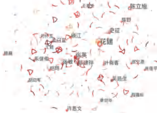
图 2 长三角文化产业研究作者合作网络

参考图谱中各节点的颜色差异并联系实际, 将长三角文化产业研究大致分为五大主题: (1) 文化资源开发及城市文化发展研究; (2) 文化体制改革研究; (3) 文化产业融合发展研究; (4) 文化创意产业发展研究; (5) 文化产业链及文化产业影响因素研究。每个主题包含的主要关键词见表 1。